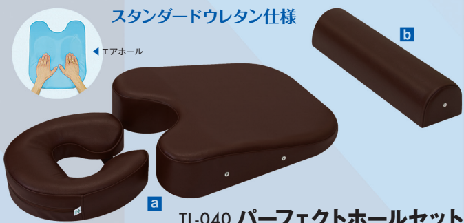
スタンダードウレタン仕様