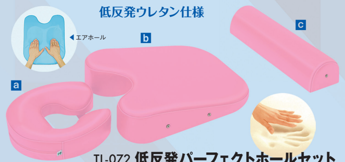
低反発ウレタン仕様