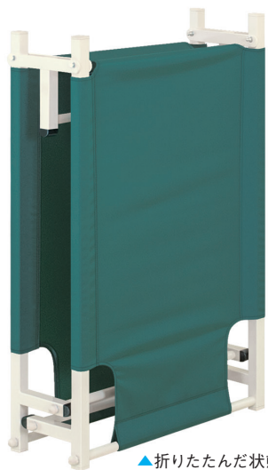
▲折りたたんだ状態