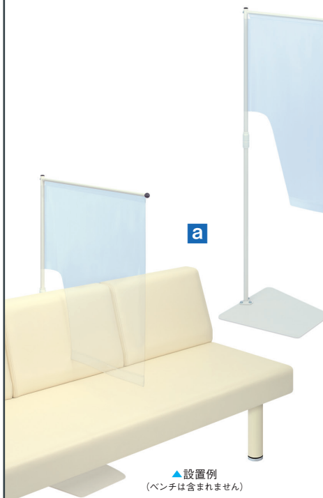
▲設置例 (ベンチは含まれません)