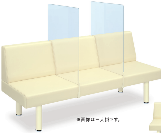
※画像は三人掛です。