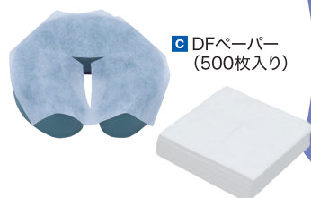
c DFペーパー (500枚入り)