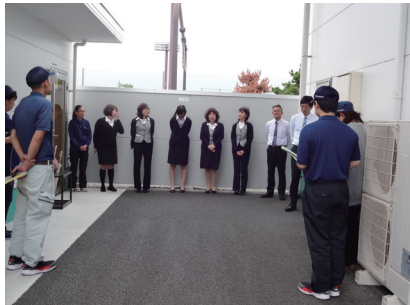
【声出し考課のようす】