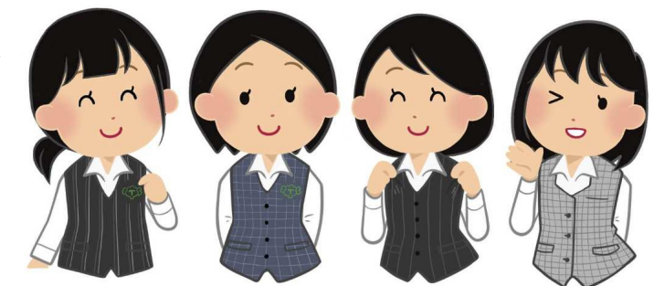
イラスト制作：伊東

三代目あたりから女性が、スカートだけでなくパンツを履くようになったそうです。そして現在着ているのが四代目の制服です。千鳥柄で色がこれまでと比べて明るくなりました。よく見るとラメが入っていてとても可愛いです。全種類着たことがある方はとってもレアです！入社して初めて来た制服は思い出が詰まっているのでしっかり覚えておきたいですね。今までの制服の写真は当社のスタッフブログの2013年5月27日の記事に載っているのでぜひ見てみてください！(伊東)