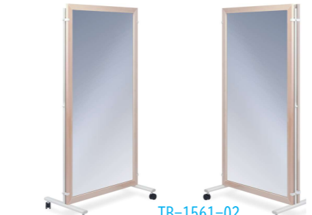
TB-1561-02 姿勢矯正用鏡(両面式)