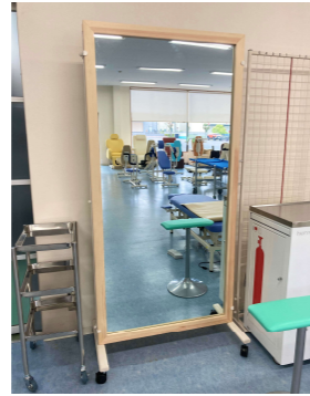
TB-1561-01 姿勢矯正用鏡(片面式)