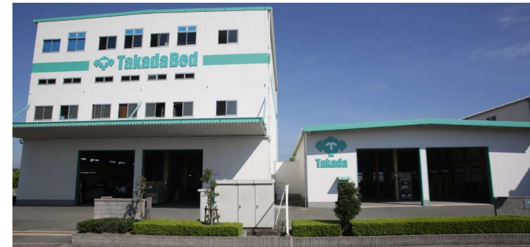
■ 第三工場/第四工場