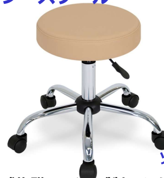
ソファー・チェアシリーズ

コンパクトで安定感抜群のスチール製クロムメッキ加工5本脚を採用。簡単なレバー操作で高さ調節できるガスシリンダー式昇降機能付き。耐久性の高い直径5cmのキャスターを採用。便利な360°回転式座面。