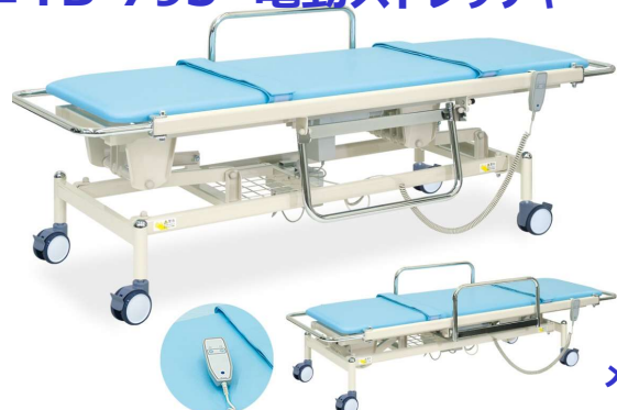
メディカルシリーズ

移動に便利なコードレス電動昇降式。安全性の高いスイングガード。AC100Vフル充電(10時間)で約50回の昇降が可能。手元スイッチ操作。直径10cmダブルロック式キャスター。レザー製安全ベルト2カ所付き。