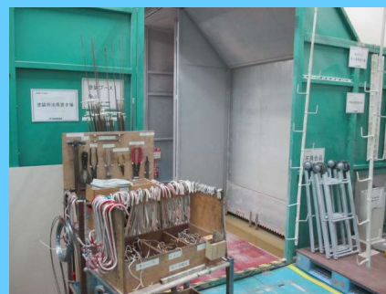
ポンプレス塗装ブース 1機