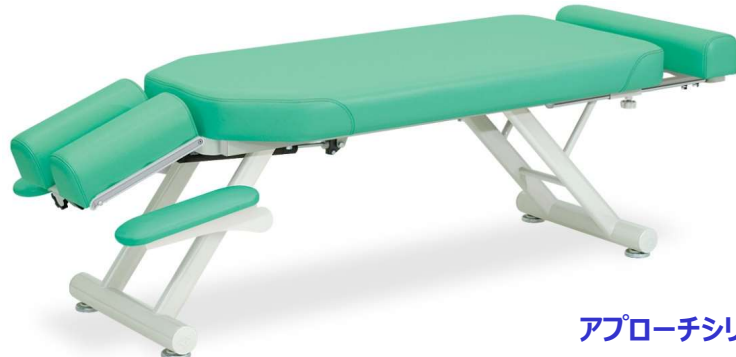
アプローチシリーズ

うつ伏せでの施術に最適な緊張を緩和する専用手置き台付き施術台。縦型調節式ヘッド。ガスシリンダー式角度調節機能付き。15°～40°。患者様の身長に応じて30cmの伸縮が可能なフットレスト機能付き。