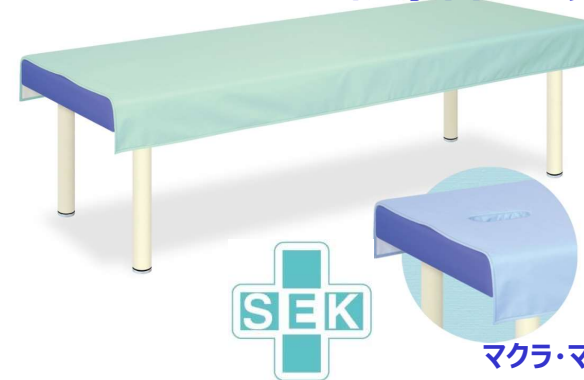
マクラ・マット・カバーシリーズ

裏面に滑り止め加工を施してズレにくくシワになりにくい材質を採用。 社繊維評価技術協議会認定(SEKマーク)の抗菌防臭加工生地。