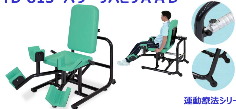
運動療法シリーズ

股関節の内転・外転筋肉を理想的な往復抵抗でリハビリトレーニング。8段階調節機能付き油圧シリンダーを採用。約1~9kgの範囲で調節可能。体格に応じて背もたれ位置が簡単に調節可能。2cm間隔5段階調節。