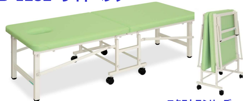
エクストラシリーズ

折りたたんで簡単に移動収納ができる直径6cmキャスター付き施術台。院内のスペースを効率的に活用できる実用的なコンパクト収納設計。