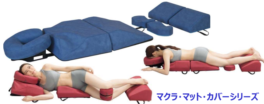
マクラ・マット・カバーシリーズ

5種類のサポートクッションから形成される極上のポジションを実現。 人間工学に基づいた自然な状態の姿勢で脱力したリラックス感を提供。 鍼灸やカイロから訪問マッサージや理学療法まで究極のボディマット。