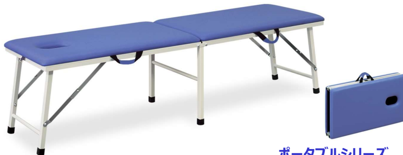
ポータブルシリーズ

安全なワンタッチロックステー式の折りたたみ式ポータブルベッド。持ち運びでの実用性を考慮した軽量でコンパクトなスチール枠構造。環境に優しい粉体塗装。床面をキズから守る専用脚キャップ付き。