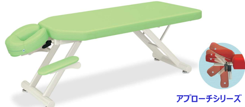
アプローチシリーズ

うつ伏せでの施術に最適な専用手置き台付き入門用廉価タイプ施術台。フェイス型ヘッド。最大10cmの高さ調節&無段階角度調節機能付き。床面との隙間を微調整できる直径6cmのオリジナルアジャスター付き。