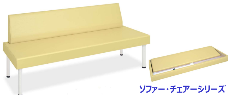
ソファー・チェアシリーズ

コストパフォーマンスを追求した背付きタイプの廉価版待合室ベンチ。背部を座シート内に収めることで物流コストを削減。簡単組立&軽量。床面との隙間を微調整できる直径3.8cmの便利なアジャスター付き。