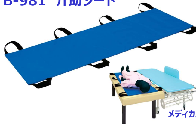
メディカルシリーズ

ストレッチャーや検査台からの移動に便利な8カ所トツテ付きシート。安全性を追求した二重生地縫製を採用。水にも強いナイロン素材。