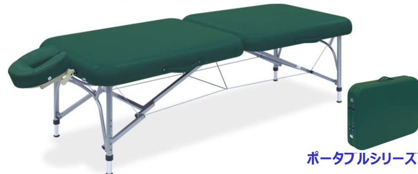
ポータブルシリーズ

軽量化と特望サイズを実現したアルミニウム仕様のポータブルベッド。シート(天板)の四隅コーナーをやさしく演出するかどまる加工を採用。プッシュ式6段階式高さ調節機能付き。差込式フェイスマット付き。