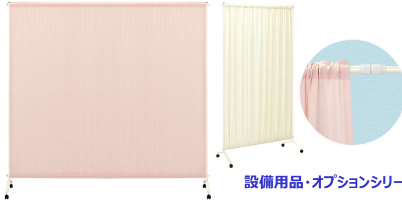
設備用品・オプションシリーズ

スペースに応じてカーテン幅を自由に伸縮できるシングルスクリーン。 環境にやさしい粉体塗装仕上げのフレームを採用。丸洗い可能な生地。