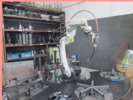
アーク溶接ロボット 1台