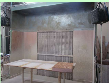
ボンドドライブース 3機