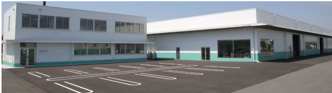
■ 本社事務所/本社工場