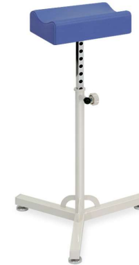
設備用品・オプションシリーズ

2.5cm間隔の14段階調節が可能な安全ストッパー式の高さ調節機能。 マジックテープ固定式で安定感の高い専用肢台クッション。