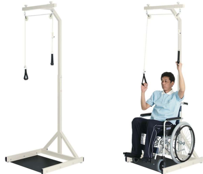
運動療法シリーズ

車イスから移動することなく上肢運動が始められる専用設計の訓練器。四十肩等の肩関節疾患や麻痺等を緩和する為の滑車式ストレッチ運動。患者様の体格に合わせて滑車幅とロープの長さを無段階に調節可能。