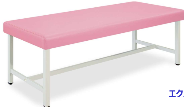
エクストラシリーズ

一般的な医科向け診察台・鍼灸治療・電気治療の施術台として開発。ベッド脚部を外側に取り付けることで外観上の安心感と安定性を実現。床面との隙間を微調整できる直径3.8cmの便利なアジャスター付き。