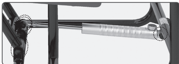
○ 摩擦音の発生する箇所

● 市販の潤滑スプレー又はグリーススプレーで、3ヶ月を目安に左記の可動部分に適量を吹き付けてください。 吹き付けを怠ると、がたつきや摩擦音の原因となります。